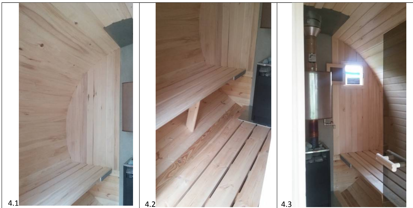
Фото №4. Отделка парилки осиновой вагонкой.

На фото №4.1 видна отделка стен и свода бани осиновой вагонкой (отделка вагонкой из лиственных пород производится под заказ.).