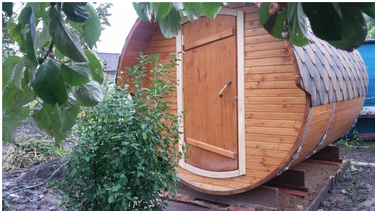
Фото №1. Общий вид бани.

Одной из отличительных особенностей наших бань-бочек – это исполнение входных дверей, выполненных в корабельном стиле .