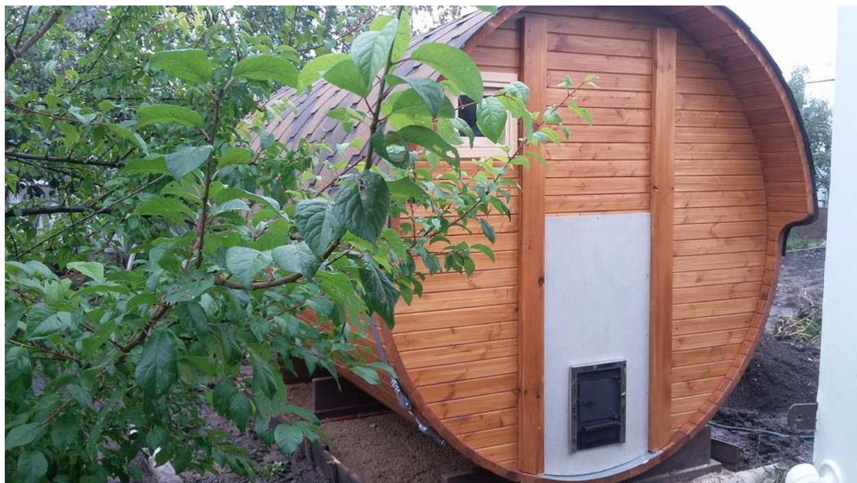
Фото №2. Общий вид.

Одно из главных наших отличий – это обслуживание печки с улицы, это очень удобно, практично и безопасно.