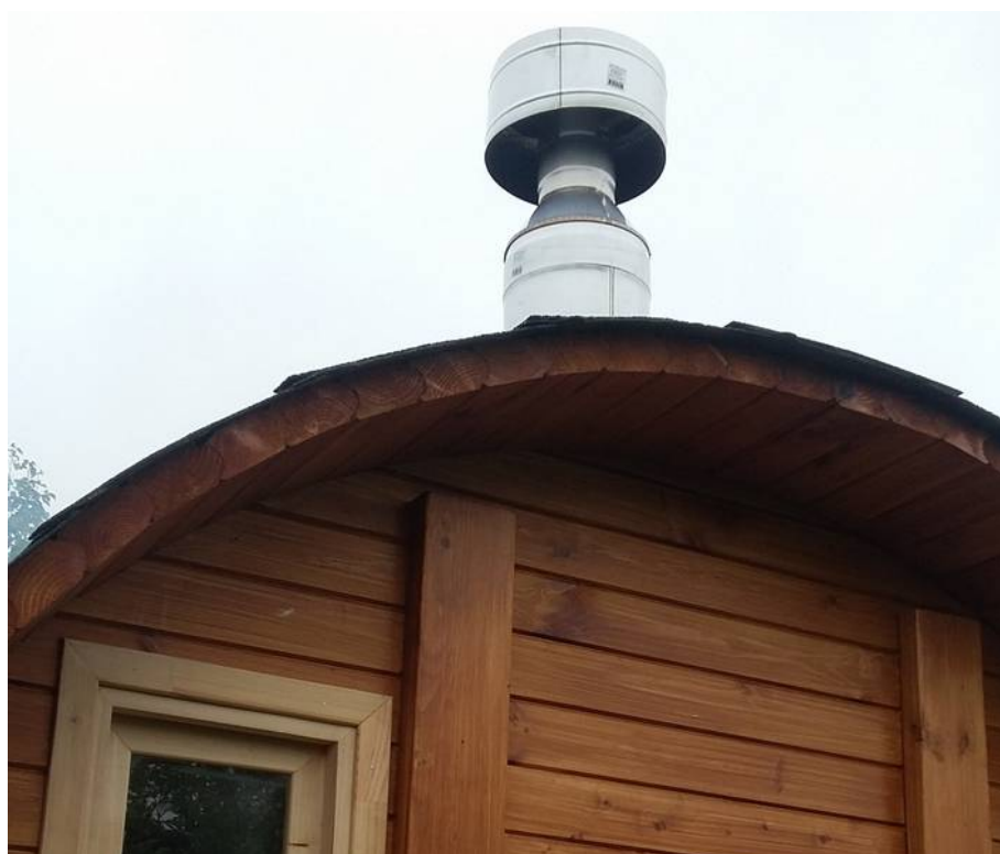
Фото №3. Искрогаситель.

Для пожарной безопасности применяем дефлектор.